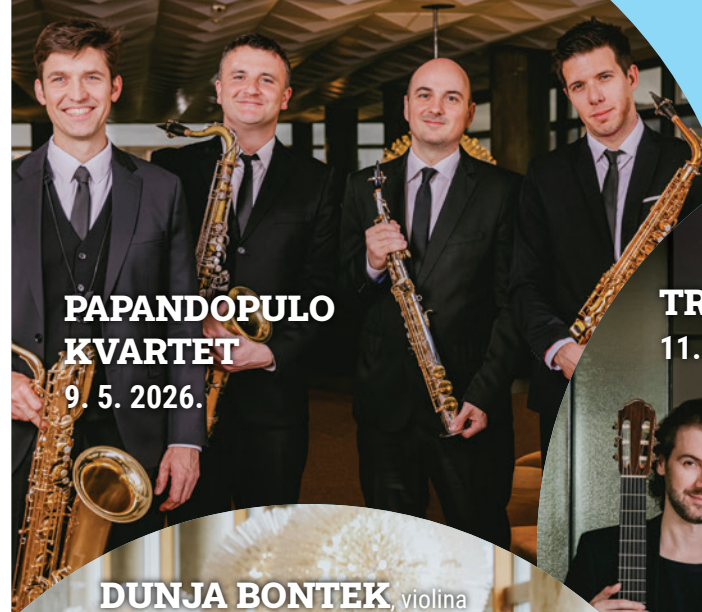
PAPANDOPULO KVARTET 9. 5. 2026.