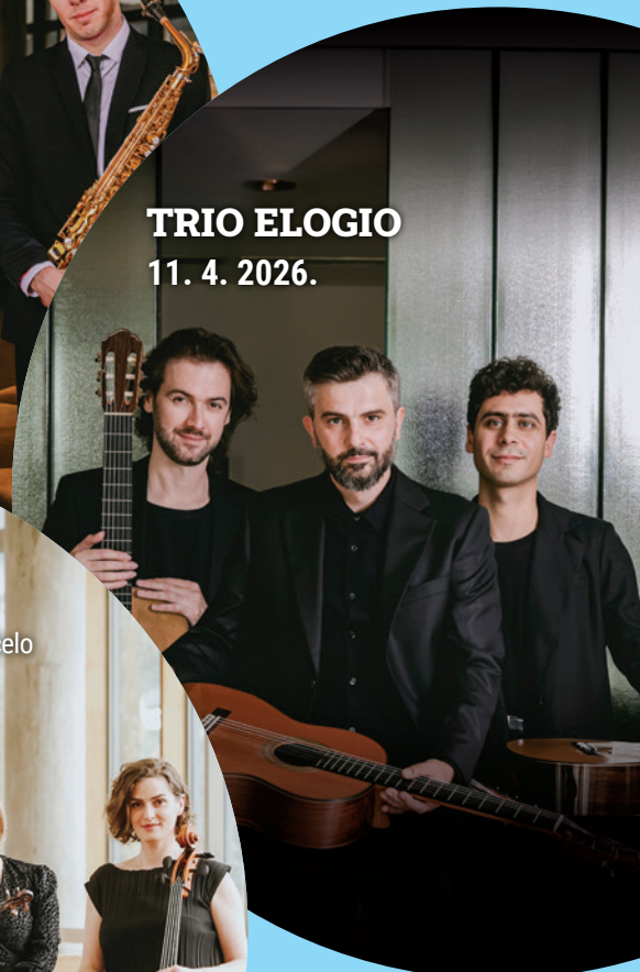
TRIO ELOGIO 11. 4. 2026.